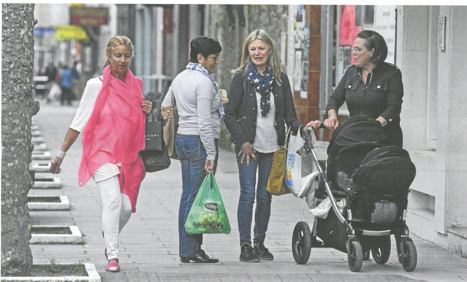
El Ayuntamiento quiere cubrir las necesidades de las familias.

«Es el apropiado. Cada bar tiene su terreno, donde pone las terrazas y ni molesta ni nada, por lo que me parece que está bien el tamaño de las terrazas».